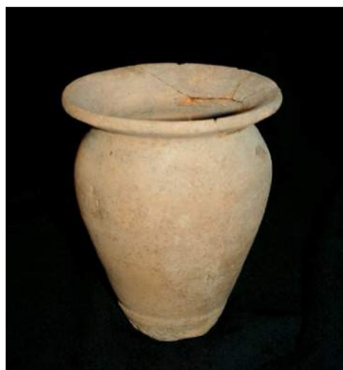
Красноглиняный гончарный сосуд (тувак) XIV века из фондовой коллекции областного краеведческого музея. Водяное городище, 2013 г.